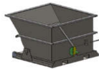
Benne auto-basculante 1,25 yd 3