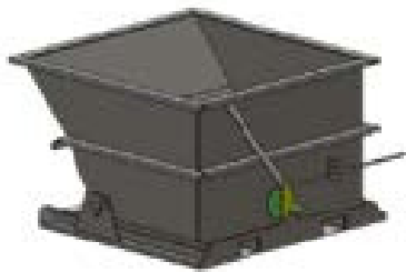
BENNE AUTO- BASCULANTE 1,9VG 3